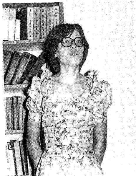
1984 год. Литературный вечер, посвященный А.С. Пушкину