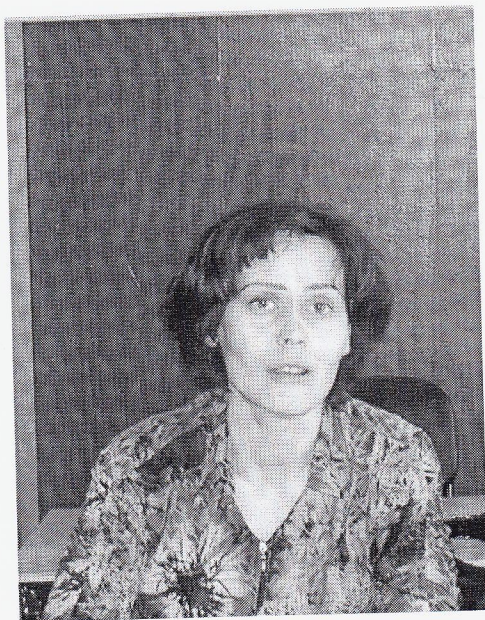
2002 год. Колледж культуры.