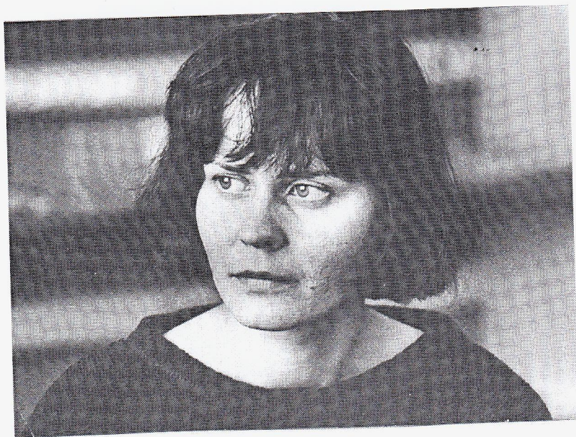
Одна из последних фотографий