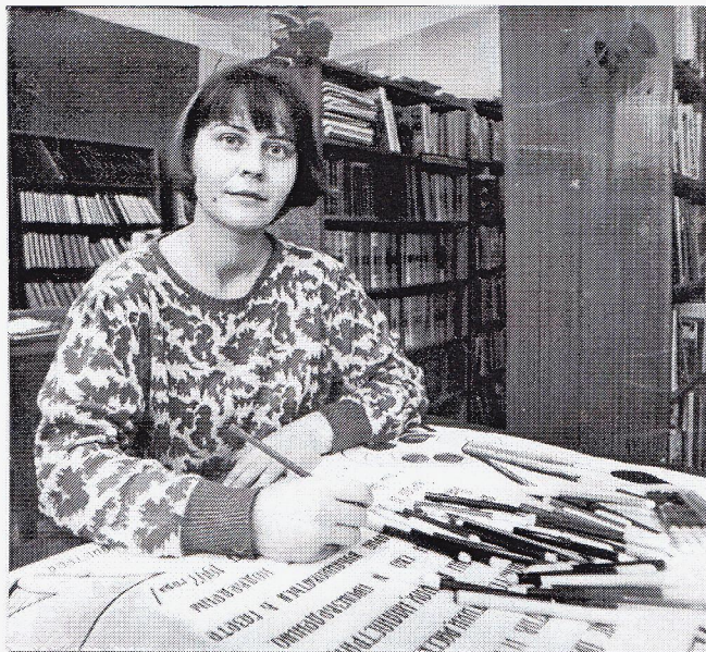
Библиотека, художник-оформитель 1995 год