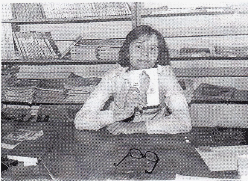
Литературный клуб «Данко». 1984 год.