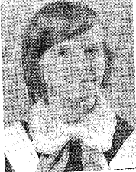
1977 год .Ученица 3 класса