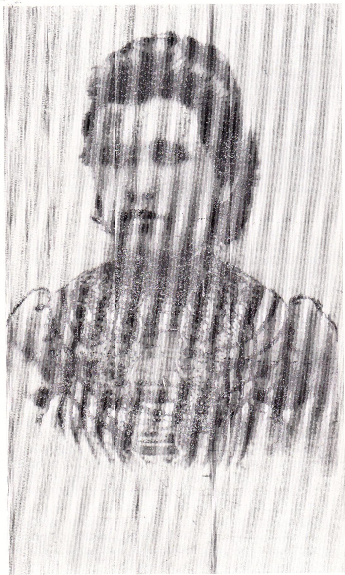
СУХАНОВА Агния Андреевна 1884—1925

115 ЛЕТ СО ДНЯ РОЖДЕНИЯ ЧУЖАН ЛУНСЯНЬ 115 ВО